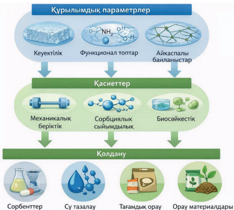
Сурет 2 – Хитозан–целлюлоза композиттеріндегі құрылым-қасиет-қолдану арасындағы өзара байланыс.

2-суретте хитозан-целлюлоза композиттерінің құрылымдық параметрлері (кеуектілік, функционал топтар, айқаспалы байланыстар), олардың негізгі физика-химиялық және функционалдық қасиеттеріне (механикалық беріктік, сорбциялық сыйымдылық, биосәйкестік) әсері және практикалық қолдану салаларымен (сорбенттер, су тазалау жүйелері, тағамдық орау, агрохимиялық материалдар) байланысы көрсетілген. Схема материал құрылымын мақсатты басқару арқылы қасиеттерді реттеу мүмкіндігін айқындайды.