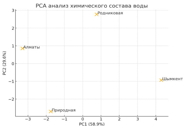
Рисунок 2 – PCA-анализ химического состава воды

Полученные результаты сравнительного анализа физико-химических характеристик питьевой, родниковой и природной воды южных регионов Казахстана свидетельствуют о том, что качество исследуемых водных источников в целом соответствует действующим санитарно-гигиеническим нормативам. Выявленные различия между образцами носят преимущественно природный характер и обусловлены геохимическими особенностями формирования вод, а не антропогенным воздействием.