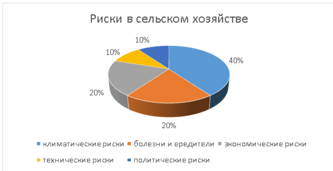
Рисунок 2. Риски в сельском хозяйстве Figure 2. The most significant risks in agriculture

При применении принципа Парето в сельском хозяйстве для управления рисками, используются популярные ключевые факторы, влияющие на результативность и безопасность производства: