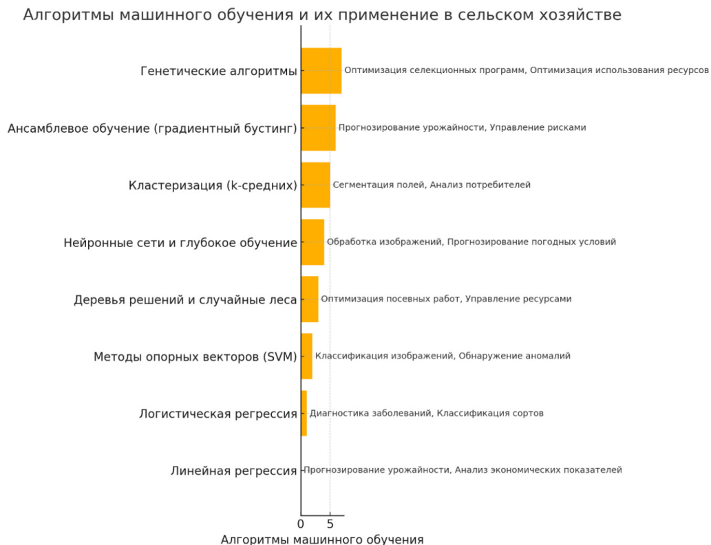
Рисунок 4. Алгоритмы машинного обучения и их применение в сельском хозяйстве

В сельском хозяйстве могут быть применены различные алгоритмы машинного обучения для решения надежных задач, связанных с оптимизацией процессов, прогнозированием (Haavelmo, 1954), мониторингом и автоматизацией, анализируя рисунок 4, наиболее подходящий алгоритм для управления рисками ансамблевое обучение (градиентный бустинг).