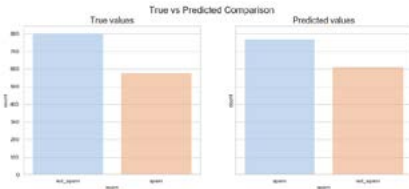
Рисунок 5. График классификации электронной почты как спама и не спама с использованием наивного байесовского классификатора