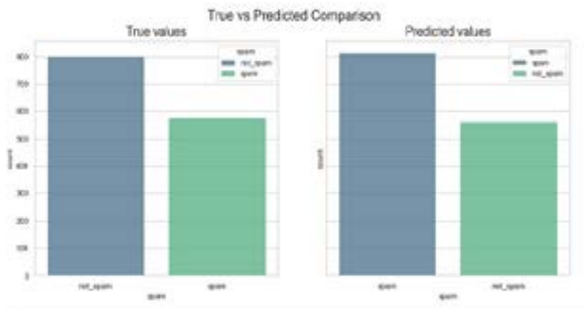
Рисунок 3. Анализ настроений по данным электронной почты с использованием наивного байесовского классификатора