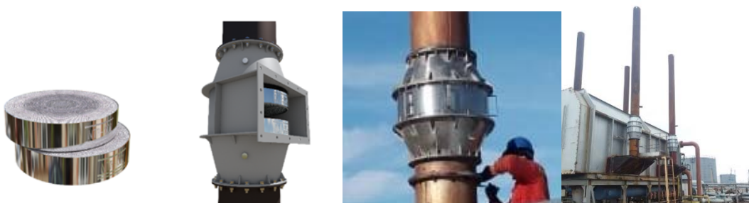
Figure 3 - Workshop products installed at industrial facilities