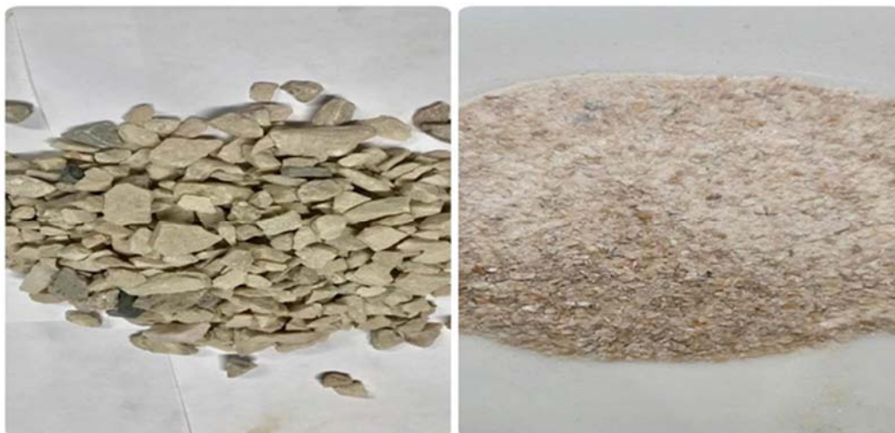
Figure 3 - A large and crushed dolomite sample taken from the «Aksay» field.