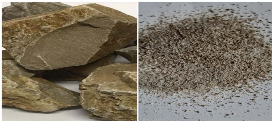
Figure 1 - A large and crushed sample of unbalanced phosphorite taken from «Aksay» field

To create a new range of mineral fertilizers-fertilizer mixture obtained from phosphates, ash and slag waste, we took samples of unbalanced phosphorite and dolomite from the «Aksay» deposit for research. figures 2,4,6 shows the result of a study of a sample of phosphate raw materials and dolomite from the «Aksay» deposit.