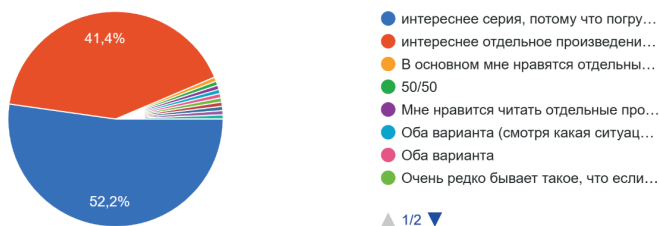
Диаграмма 1 – Выбор предпочтений: сериал или отдельное произведение.

Как видно из диаграммы, молодежь отдает первенство литературным сериалам, предпочитая их отдельным произведениям. Некоторые респонденты (их очень мало) выбирают оба варианта.