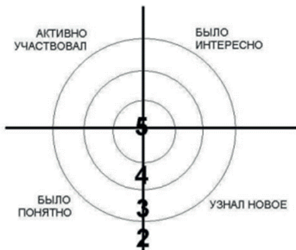
Рисунок 2 - Рефлексия «Мишень»