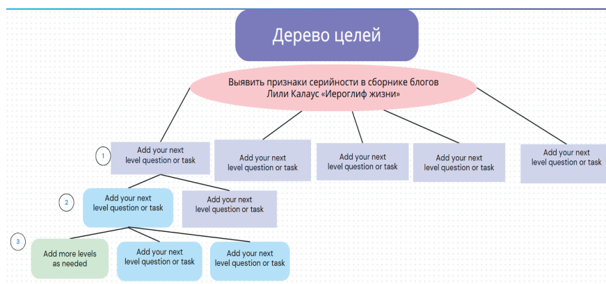
Рисунок 1 – Дерево целей. (Примечание: 1-й, 2-й и 3-й уровни заполняют в группах при поддержке преподавателя или без).

Основная цель – выявить признаки серийности в сборнике блогов Лили Калаус «Иероглиф жизни». Для достижения поставленной цели необходимо выполнить задачи первого уровня. Для этого необходима декомпозиция основной цели на задачи, которые формулируются студентами вместе с преподавателем. Задачи остальных уровней определяют и составляют сами студенты в группах. Групп необходимо столько, сколько задач первого уровня.