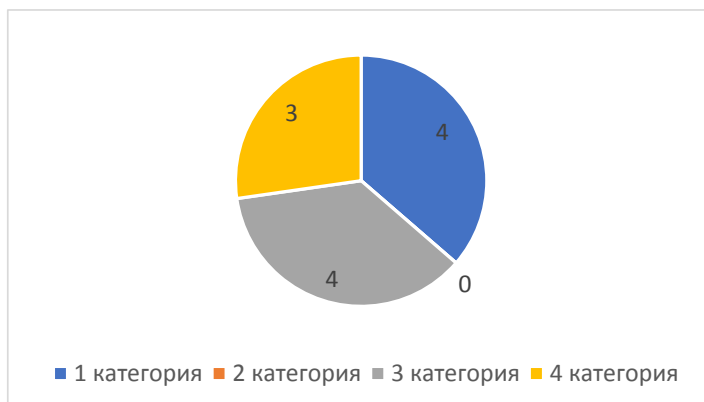
Рис. 2 - Категории социальных предпринимателей в Актыбинской области

На данный момент в Актыбинской области есть 11 социальных предпринимателей, зарегистрированных в Реестре. Они занимаются различными видами деятельности, включая инклюзивное образование, оказание услуг и работу в легкой промышленности.