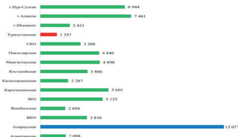
Figure 2 - GRP per capita in 2021 by regions, thousands tenge

The main reason for these problems is the current system of inter-budget relations, built on the principle of centralized distribution of revenues and expenditures to the regions, which does not provide an effective alignment of imbalances between them.