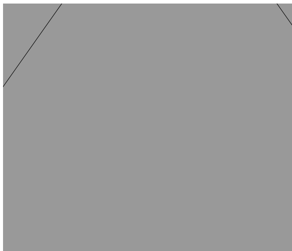
Сурет 3 - Аймақтық экономикалық саясаттың құралдары. Ескерту-авторлардың құрастыруы негізінде жасалған

Сурет 3-те проблемалық (депрессиялық) аймақтардағы аймақтық экономикалық саясаттың құралдары ұсынылған.