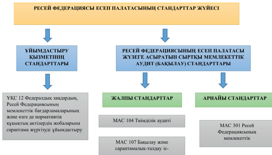
Сурет 2. Мемлекеттік бағдарламаларға аудит жүргізу барысында қолданылатын стандарттар

Ресей Федерациясы Есеп палатасының стандарттары ұйымдастыру қызметінің стандарттары мен сыртқы мемлекеттік аудит стандарттары болып екіге бөлінеді. Сыртқы мемлекеттік аудит стандарттарының үш түрі бар: жалпы стандарттар, арнайы стандарттар және Ресей Федерациясының федералдық бюджеті мен мемлекеттік бюджеттен тыс қорлары бюджеттерінің аудит (бақылау) стандарттары. Мемлекеттік бағдарламаларға аудит жүргізу барысында қолданылатын стандарттар 2-ші суретте көрсетілген.