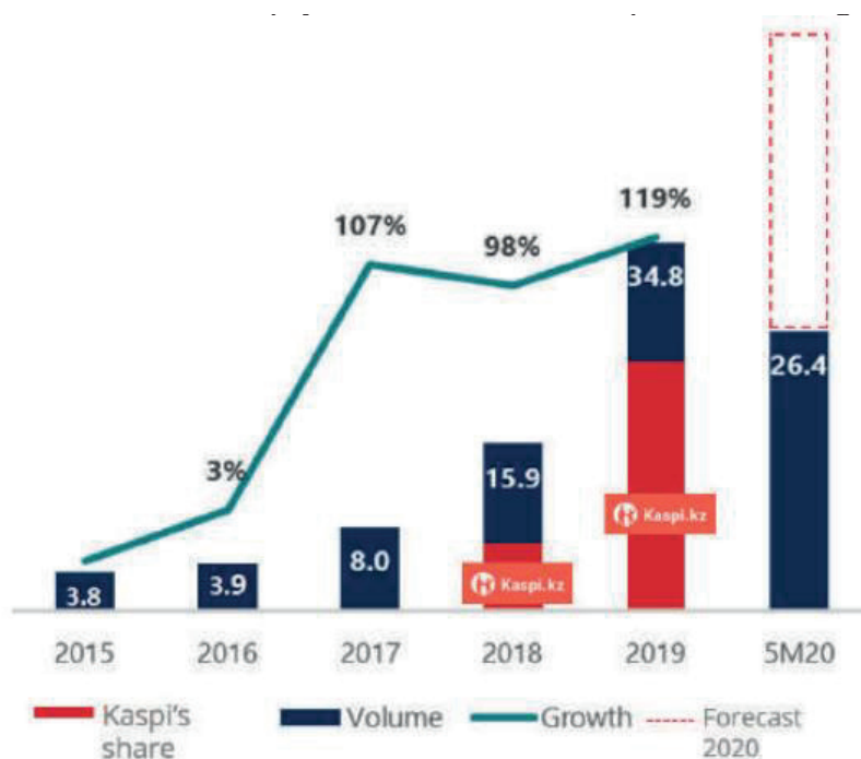
Figure 2. The volume of cashless payments, USD billion.

Note: Based on data from Fintech Market Entry to CIS Central Asia and Mongolia.